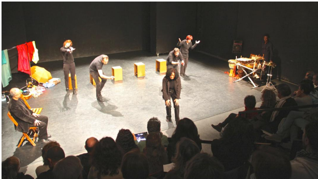
Fotografía 1. El espacio escenográfico del TPk

diversos que servirán para caracterizar a los personajes, indicar el espacio dramático o representar simbólicamente otros elementos de la narración.